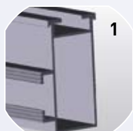
1. Systemträger in den Festigkeiten (Ix-Werte 7 u. 13)