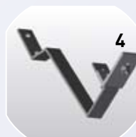
4. Dachhaken Biber