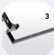
3. Dachhaken Schindel